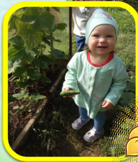
Наш любимый огород всегда требует забот.