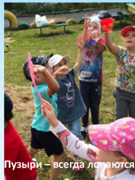
Пузыри – всегда лопаются