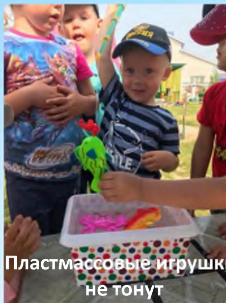
Пластмассовые игрушки не тонут