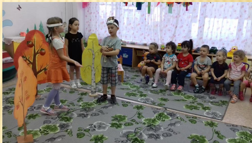
Показываем сказку малышам «Добрый медвежонок»