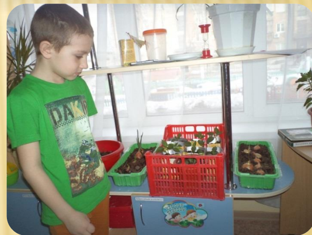
Огород на окне