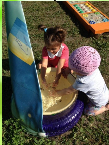
Игры с водой