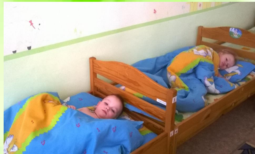
Соблюдение режима дня