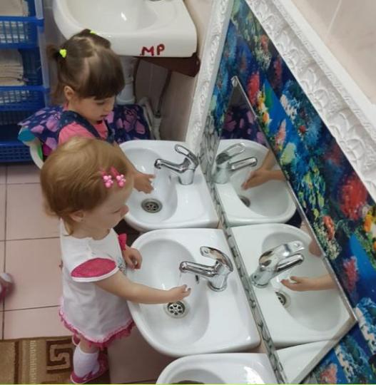
Воспитание и формирование культурно – гигиенических навыков