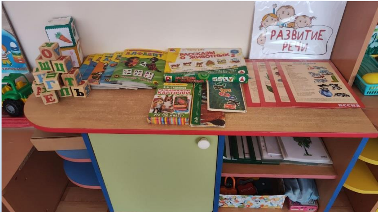
Центр речевого развития